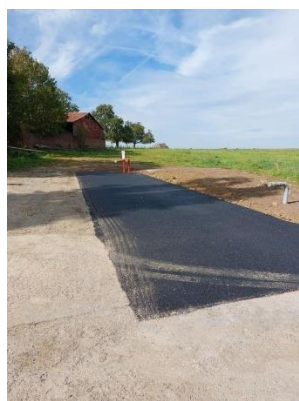
Réserve incendie Ferme de BEAUCHEMONT