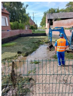
Réserve incendie centre village

Comme annoncé dans le bulletin 2023, la réserve incendie de la Ferme BEAUCHEMONT est terminée et nous sommes toujours en réflexion avec l'entreprise Pivetta pour l'étanchéité de la réserve du centre du village.