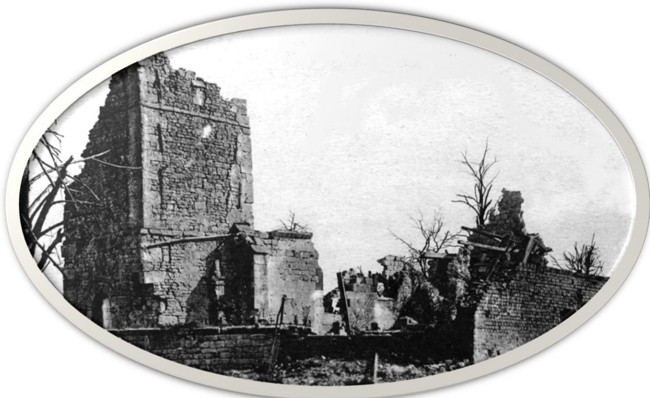
Détruite à l'issue de la guerre 14-18